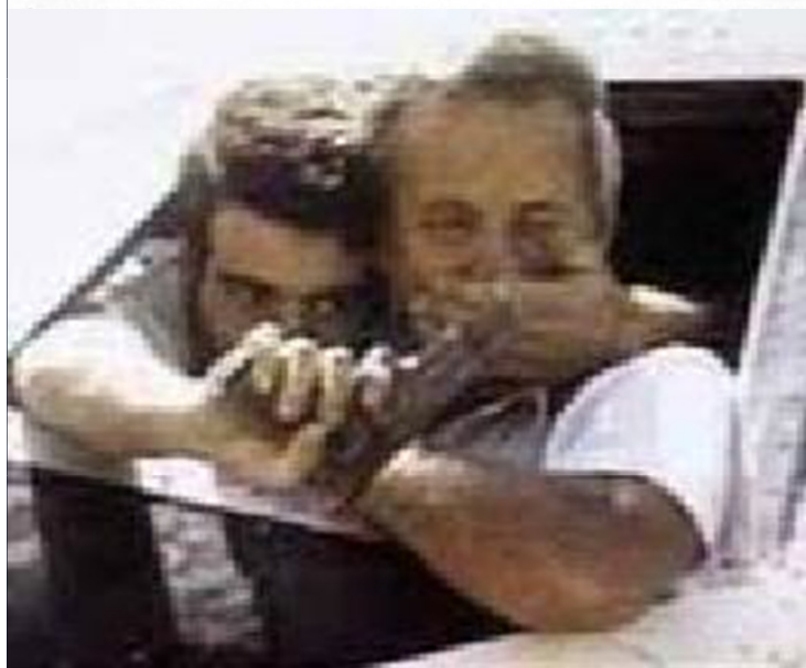
REJOICING—Part of crowd at airport in Tel Aviv that met